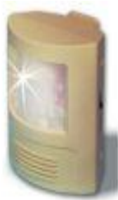
Flash porte entrée