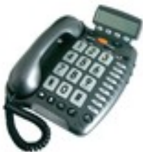
Tél amplifié + flash + utilisable avec la position T