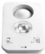
Amplificateur de sonnerie de tél (Ring Plus) + 95 Db + Flash lumineux