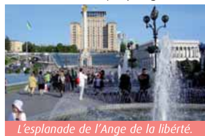
L'esplanade de l'Ange de la liberté.

Il y a une foule d'autres curiosités, musées, palais Mariinsky, Portes Dorées, de très beaux parcs, un Pont des amoureux comme à Florence (c'est-à-dire couvert de cadenas et de rubans accrochés par des couples qui ont voulu symboliser l'éternité de leur amour), et pour les soirées culture, un Opéra extraordinaire. J'y ai enchaîné « Carmen », « Gisèle » et « Madame Butterfly ». Même pour de belles places en hauteur, les prix sont plus qu'accessibles (enfin pour nous). Public chaleureux, niveau des chanteurs (et de l'orchestre) irréprochable. Pourtant, lors d'un entracte, j'ai vu l'horreur aussi, des Français qui occupaient une loge ont sorti soudain des assiettes en plastique, des crudités, du pain, des bouteilles de coke... et se sont mis à manger ! En une minute, tout le monde avait les yeux fixés sur eux. Mais en fait, les gens rigolaient, alors qu'à Paris ou à Vienne, ces quatre spectateurs auraient probablement été mis dehors ! Il est une chose qui reste, dans l'Europe entière, sans équivalent : la fameuse avenue « Khrechatik » - ce sont, en gros, « leurs » Champs-Élysées ! Certains jours à certaines heures, le trafic automobile y est interdit et alors on voit une marée humaine bavarder, rire ou faire de la musique sur ces huit voies auxquelles s'ajoutent les immenses trottoirs, les squares devant les statues d'or grandioses, les fontaines... Ahuri, j'ai plongé.