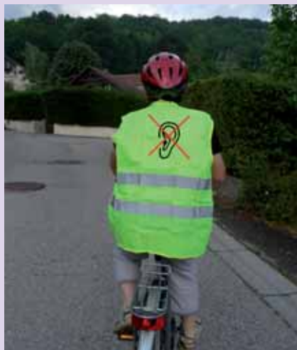
Un sourd qui s'affiche!

Parallèlement, se déroule le projet européen REACH 112 , expérimenté dans 5 pays, dont la France où ce travail a été confié aux partenaires français : CHU de Grenoble, Websourd, Orange, Ivès (support technique).