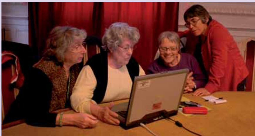
Les volontaires de l'ARDDS 38 au clavier.

Cela comprend toutes les aides techniques à la compréhension, qu'elles soient individuelles comme les micros, les casques télé, les boucles magnétiques de guichet, le sur titrage télévisé, ou collectives comme les boucles d'induc-