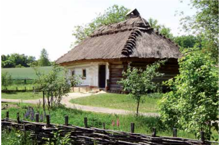
L'école du village.

J'ai l'habitude de manger sur Khrechatik, dans un ou deux restos où l'on goûte l'excellence de la cuisine ukrainienne, leur borchtch, leurs varenikis au chou, à la pomme de terre ou au fromage blanc, et leurs généreuses pâtisseries. Jamais je n'en ai eu pour plus de 4 euros. Et on peut manger à toute heure !