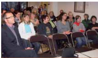
L'assemblée : 50 personnes, quand même !