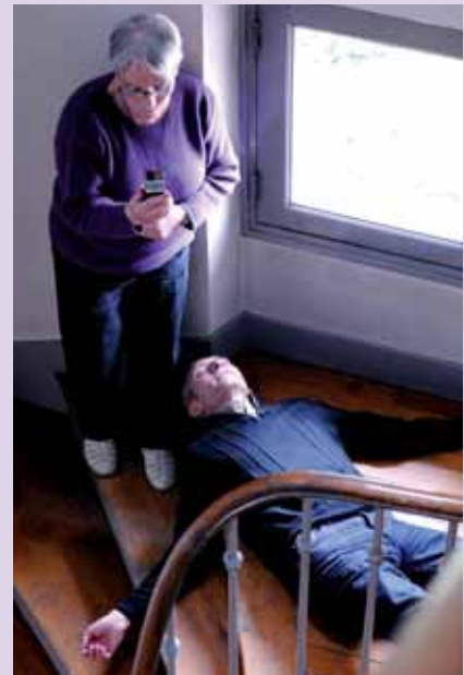
Le texte du dialogue apparaît sur le visiophone 3G.

Ensuite, l'appelant a composé le numéro par l'ordinateur ou le smartphone 3G. Il parlait et l'opérateur répondait en parlant, avec la webcam (caméra sur l'ordinateur). Le texte apparaissait en temps réel sur le cadran du mobile 3G.